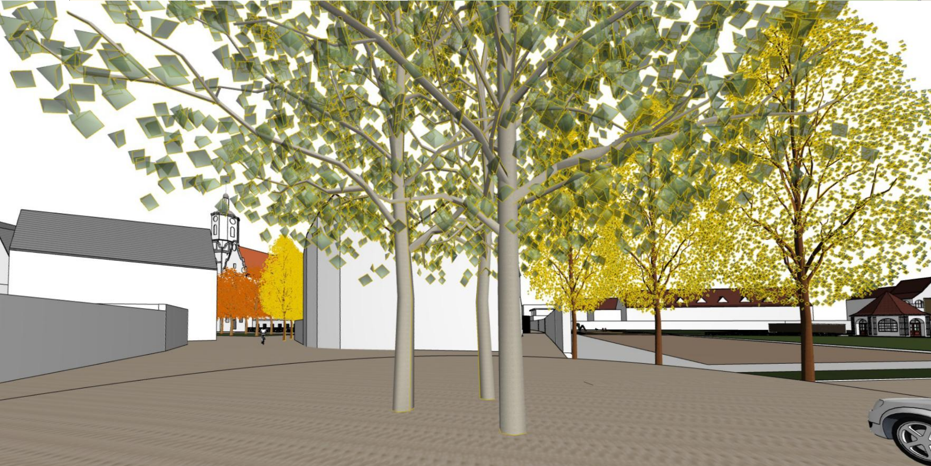
BAUMGRUPPE MIT BLICK ZUM STEPHANSPLATZ UND IN DEN GARTEN